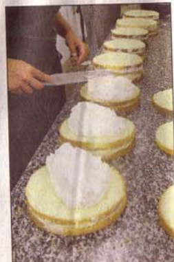
Gräde på. Understa lagret har fått vaniljkräm. Nu ska grädden på i andra lagret.