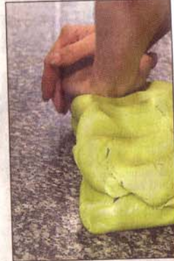
Knådning. Den stora marsipanklumpen ska knådas nog.