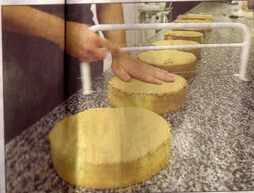
Tårtprocessen. Ett praktiskt verktyg delar upp tårbottnarna i tre delar. Prinsesstårta är den allra vanligaste sorten på bröllopstårter. I Värnamo är även chokladmint populärt.

JEANETTE JOHNSSON jeanette.johnsson@varnamonyheter.se