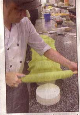
Sluttampen. Marsipanen rullas på tårterna. För att sedan skäras så att den passar.